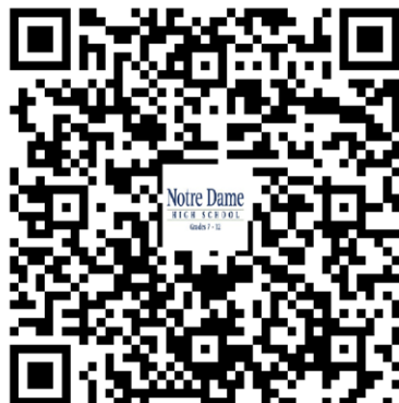
更多照片、视频、学费等信息请扫描二维码 本页所载信息仅供参考，具体请以校方发布信息为准